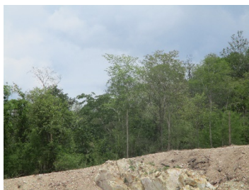
แนวเวนไม่ทำเหมือง