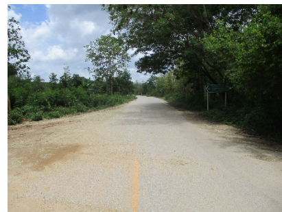
ทางหลวงหมายเลข 1335