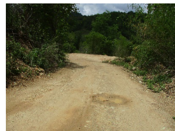
เส้นทางขนส่งแร่