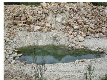
บ่อรองรับน้ำ